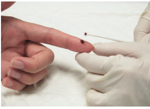
රුධිරය ගැනීම සඳහා ඇඟිලි තුඩ සිදුරු කිරීම