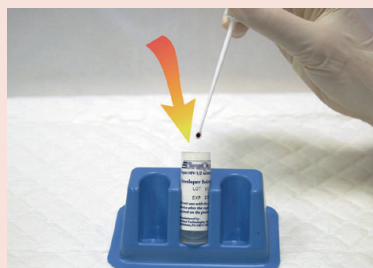
(2) Đặt que cấy đầu vòng tròn (chứa máu) vào bộ dụng cụ xét nghiệm