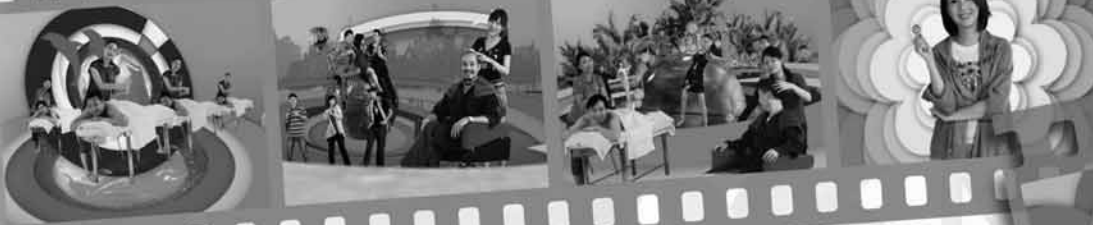
電視宣傳短片「安全套隨身 旅遊好安心」。