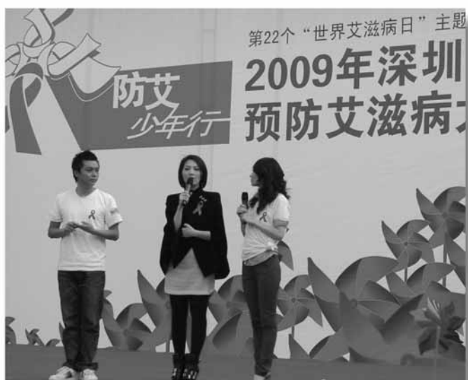
聯合國愛滋病規劃署中國香港親善大使楊千嬅親臨現場為深圳防艾宣傳助陣。

意識，同時亦強調在非旅遊期間也應注意安全性行為。楊小姐還介紹了她的官方網站「關心愛滋千嬅話你知」，網址是： http://miriam.rrc-hk.com/ 。在活動的尾聲，楊小姐聯同其他主禮嘉賓在橫幅上簽名，再次表示支持、並激勵公眾接納和關懷愛滋病病毒感染者。