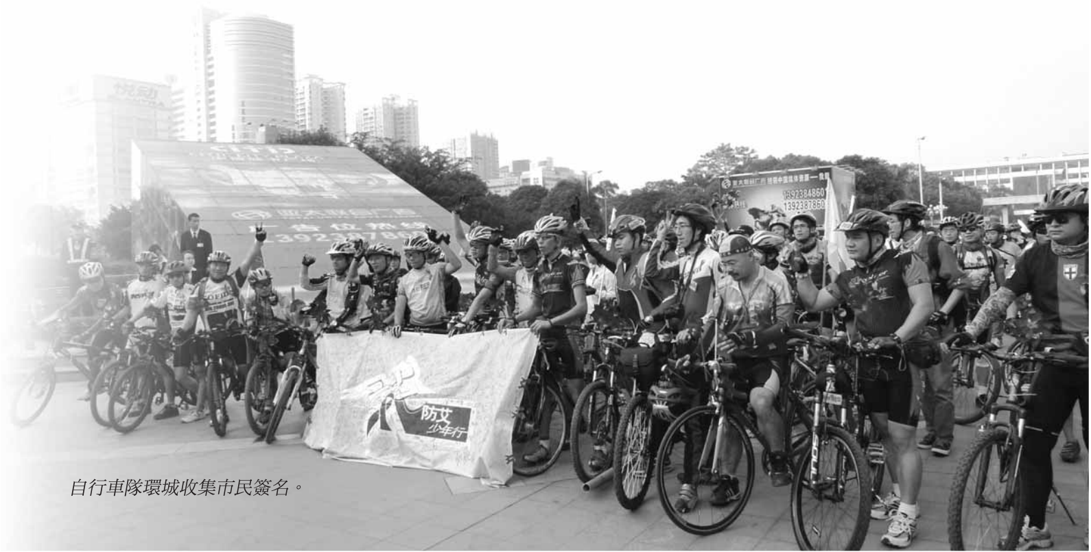
自行車隊環城收集市民簽名。

多年來，紅絲帶中心與深圳市疾控中心在監察和預防工作上通力合作。自2006年開始，雙方每隔大約半年便分享流行病學和區內愛滋病情況等資料。而由2007年開始，澳門疾控中心也參加了這個定期會議。透過這些定期交流，促使大家更能掌握珠江三角洲內各相鄰地區的最新進展及對抗愛滋病的經驗。除此，深圳和香港兩地亦定期進