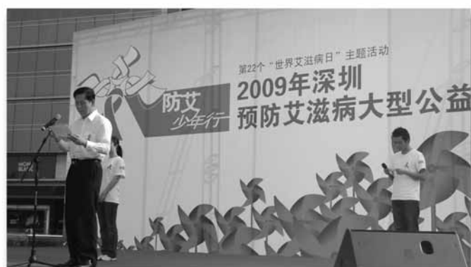
深圳市防治愛滋病工作委員會主任、副市長唐傑為活動致辭。

深圳市副市長唐杰正式宣佈啟幕。在該活動中，唐副市長陳述了深圳的愛滋病工作，並向提供愛滋病服務的工作人員致謝。此外，深圳市疾病預防控制中心主任程錦泉醫生向與會者講解有關愛滋病的信息，還強調了預防愛滋病的重要性。而其他活動包括：讓活動參加者認識愛滋病的「迷