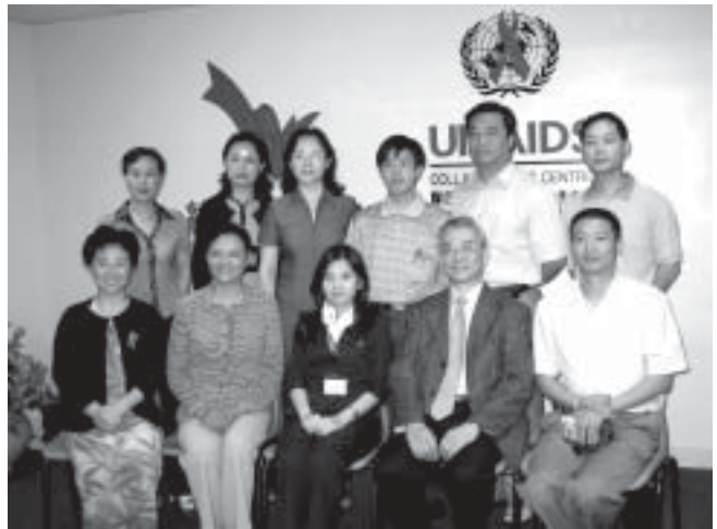
紅絲帶中心及香港戒毒會為來自中國貴州的代表講解有關防治愛滋病的項目

愛滋病在中國不同的省份地域都有著不同或獨特的影響。在貴州，感染愛滋病病毒的毒品使用者正在顯著增加，這個情況其實在世界上其他地區已有闡述，然而歷史一再重演，令人感到遺憾。希望透過貴州同仁的努力，能有效地控制這疫情的蔓延。