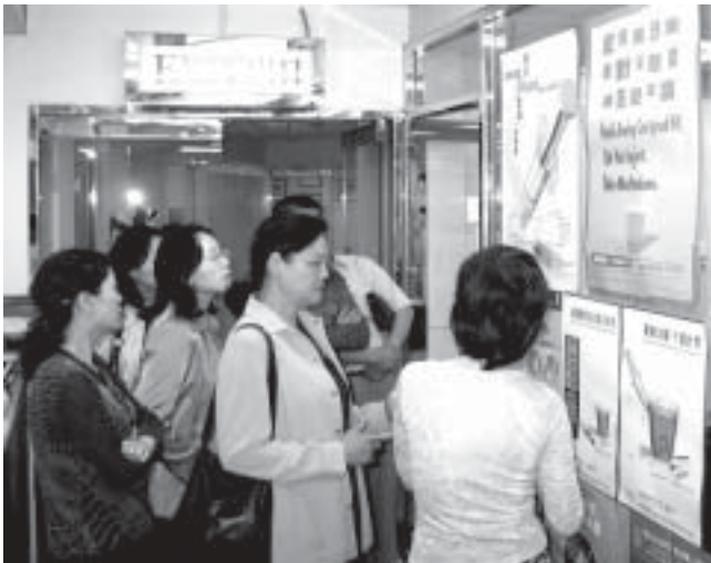
紅絲帶中心職員向貴州代表團介紹中心不同類型的資源

美沙酮治療計劃即將在中國多個試驗點開展，令人深感興奮。本年四月底，紅絲帶中心接待了一個來自貴州省的代表團，並與他們分享香港在毒品使用者中預防愛滋病的經驗。