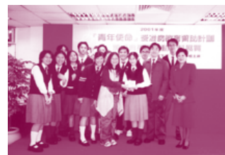
最佳活動計劃獎得主：佛教慈航智林紀念中學的師生與嘉賓合照。