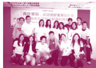
最佳演繹獎得主：基督教香港信義會北區外展社會工作隊(I)的社工及青少年義工與嘉賓合照。

頒獎典禮後得獎團體的青年人與蔡子健分享有關性及愛滋病教育的經驗，討論過程中台上台下打成一片，整個頒獎典禮活動於一片歡欣氣氛中完結。讀者們如想成為他們的一份子，快快組隊參加2002年度「青年使命」愛滋病教育資助計劃，在青年群體中推行愛滋病教育吧！