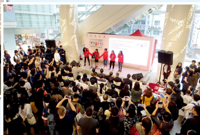
嘉許禮吸引了過千市民圍觀

請瀏覽家計會性教育網頁 ( http://www.famplan.org.hk/sexedu/ ) 或 Facebook 專頁 ( https://www.facebook.com/FPAHK.Education/ )，了解更多活動詳情。