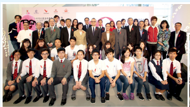
主禮嘉賓與各學校代表合照

「你知我知無人滋」以問卷調查同學對愛滋病的認識，再以猜燈謎遊戲增加同學的知識、釐清謬誤，配以擁抱行動鼓勵參加者包容愛滋病患者。