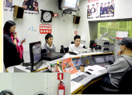
「我接納・我關心」系列 廣播節目

為響應2012年全球同抗愛滋病運動，紅絲帶中心與香港電台第二台合作，於2012年9月上旬推出一系列名為「我接納・我關心」的廣播節目，透過港台節目「Gimme 5」、「大學站」及「自己人」，邀請不同界別的人士接受互動訪問，讓聽眾瞭解更多與愛滋病相關的資訊，從而支持及接納愛滋病毒感染者和患者。