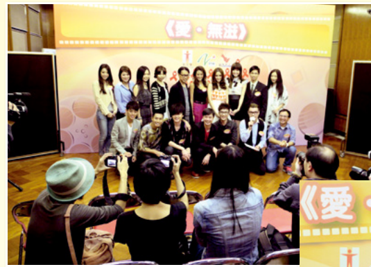
「全球同抗愛滋病運動—我接納 我關心」 微電影：《愛・無滋》宣傳記者會

這套微電影被安排於去年11月30日微電影：《愛・無滋》首映暨 2012 年世界愛滋病日活動開展禮上作全港首影。首映禮當晚衣香鬢影，星光熠熠，除一班參與及到場支持此項盛事的演藝界朋友外，更邀請到食物及衛生局局長高永文、衛生署署長陳漢儀、副廣播處長（發展）戴淑嫻、深圳市疾病預防控制中心副主任馬漢武、澳門特區政府防治愛滋病委員會秘書長林松、愛滋病顧問局主席范瑩孫、愛滋病信託基金委員會主席吳馬太、衛生署衛生防護中心總監曾浩輝、紅絲帶中心管理諮詢委員會主席陳立志，一同主持象徵打破「歧視、漠不關心、誤解、抗拒」等社會障礙物的啟播儀式，喻意以微電影的威力呼籲社會各界同心合力，打破對愛滋病感染者的成見，實踐「我接納・我關心」。