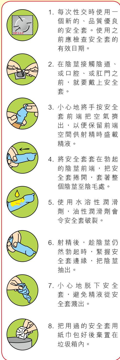
圖二. 正確使用安全套的步驟

紅絲帶中心將於2013年4月起，舉行名為「各自有一套」的專題展覽，搜羅了市面上不同款式、質料的安全套，以加深市民對安全套的認識，鼓勵市民在日常生活中能持續及正確使用安全套，以減低感染性病/愛滋病的風險。歡迎各界人士蒞臨本中心參觀。