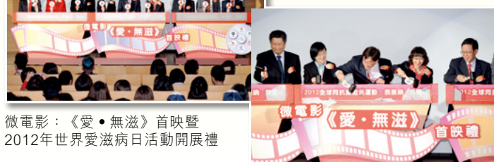
微電影：《愛・無滋》首映暨 2012年世界愛滋病日活動開展禮

微電影：《愛・無滋》在首影後亦存載於港台網站，並製成DVD免費派發予全港中學及社會團體作為教材，廣泛呼籲市民大眾能夠排除歧見，關懷與接納愛滋病患者。