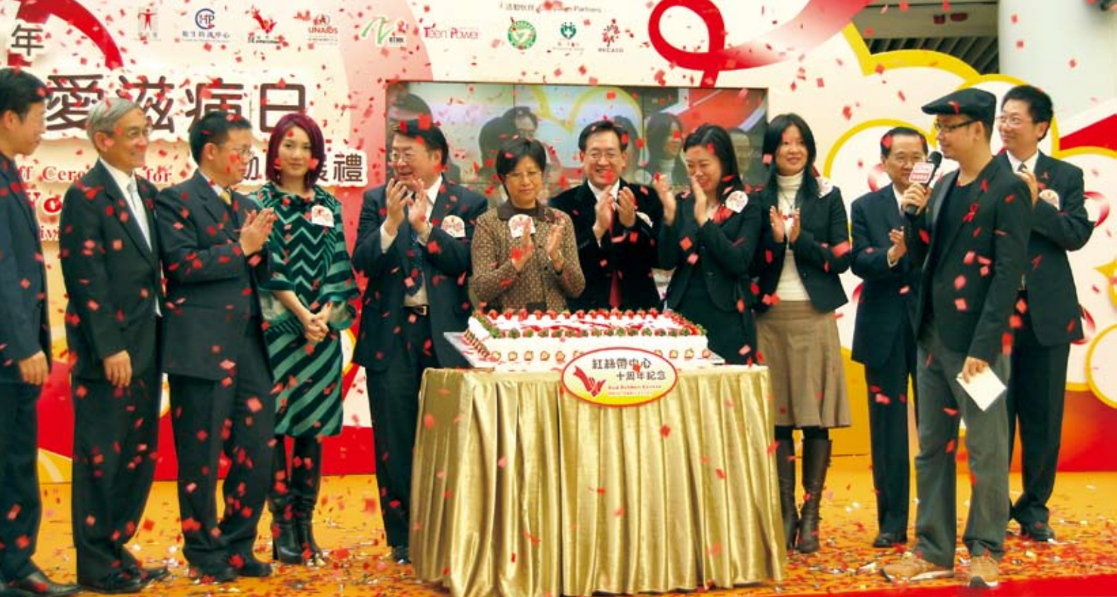
■ 為慶祝紅絲帶中心成立十周年，眾主禮嘉賓舉行切蛋糕儀式。

定得！」的海報，偌大的屏幕上亦播放着預防愛滋病的宣傳短片。在會場的四週，醫療輔助隊的同工們向市民派發紅絲帶及宣傳單張，把「關注愛滋病」的信息宣揚開去。隨着嘉賓、記者、工作人員及市民的參與，整體氣氛非常熱烈。