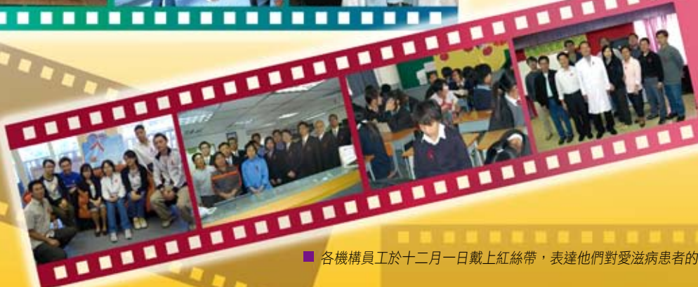
■ 各機構員工於十二月一日戴上紅絲帶，表達他們對愛滋病患者的關懷和支持。