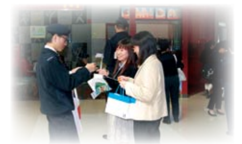
醫療輔助隊同工在場內派發紅絲帶，呼籲市民在當天戴上。

是日下午一時許，工作人員已將場地佈置妥當，會場上的展覽板貼滿「堅守承諾，共抗愛滋」及「接納、關懷愛滋病患者，你—