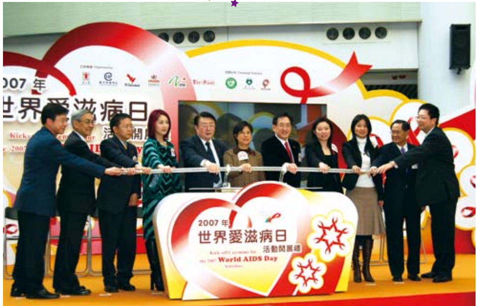
眾主禮嘉賓在台上主持活動開展禮啟動儀式。

UNAIDS COLLABORATING CENTRE 聯合國愛滋病規劃署合作中心 for Technical Support (專業支援)