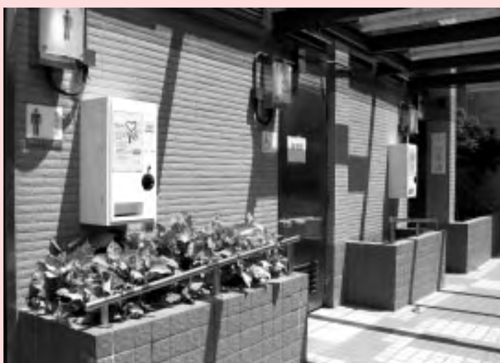
■安全套派發機首次安裝在公共廁所，讓市民免費索取安全套。初步觀察，反應良好。

在9月期間，已經有超過60,000個附有安全性行為資訊的安全套，透過安全套分發網絡派發到市民手中，令市民大眾更關注安全性行為，對安全套的使用有一個正面的看法，這正是「要有一套」安全性行為推廣運動所希望帶出的訊息。