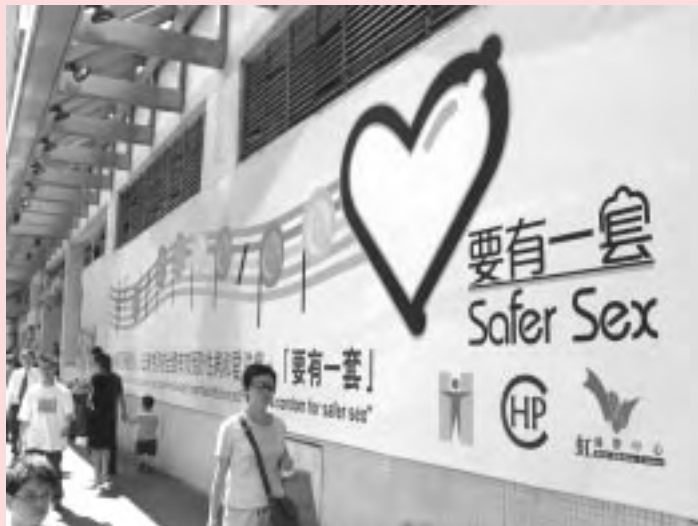
■奪目的大型橫額，喚起市民對安全性行為的關注。