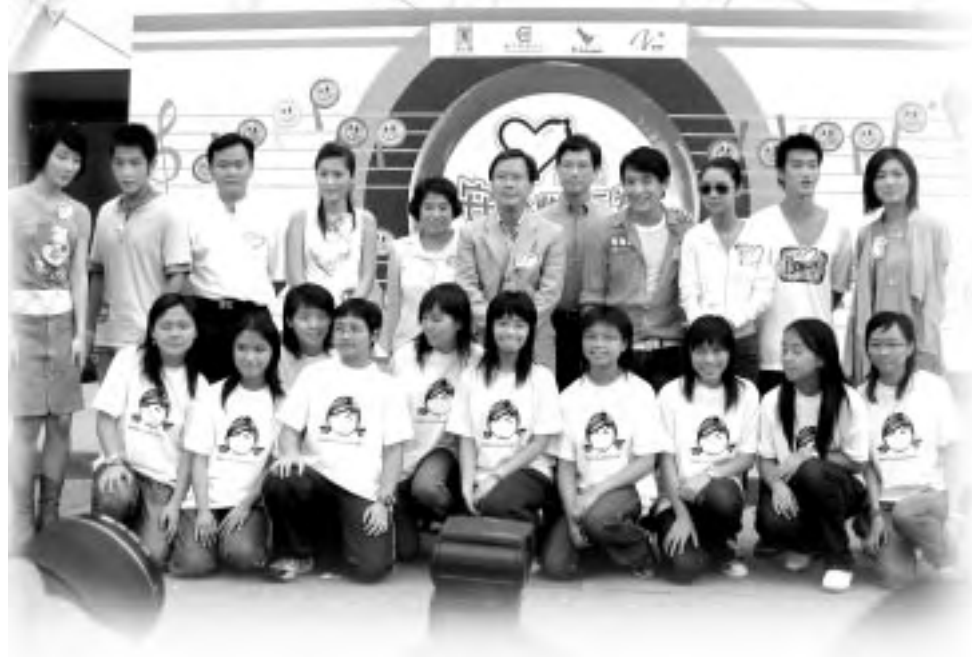
各主禮嘉賓、歌手及小小性博士齊齊大合照，一起支持安全性行為的健康訊息。