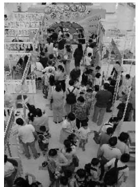
「緩減毒害轉轉轉」遊戲透過簡單的文字和圖畫讓參加者了解緩害對愛滋病預防的好處。