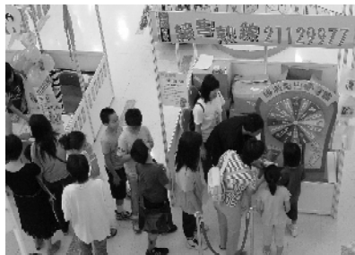
「打通健康熱線 連接美好人生 - 衛生署健康熱線繽紛同樂日」所送出的豐富獎品。