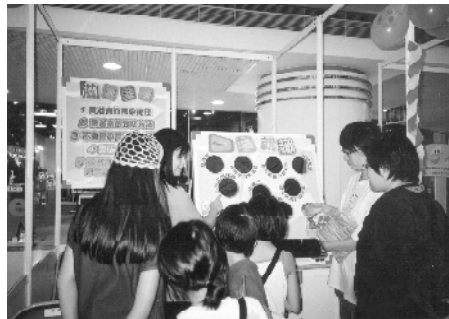
工作人員向參加者講解愛滋病知識。

如果你錯過了上述的精彩節目，可參閱以下列出參與是次活動的健康熱線名稱及號碼，不妨試打上這些熱線，讓你能收聽健康資訊，掌握預防疾病的方法；但若你也要親身感受當天的歡樂和熱鬧及贏取豐富獎品，你只好留意紅絲帶中心的動向，下次有同類節目時親自到來大顯身手。