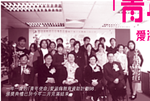
一年一度的「青年使命」愛滋病教育資助計劃98頒獎典禮已於今年二月完滿結束

愛滋病教育及宣傳委員會轄下青少年專責小組為喚起青年人對愛滋病的認識及關注，已連續數年舉辦「青年使命」愛滋病教育資助計劃，藉此鼓勵青年人以小組形式，自行策劃有關愛滋病的宣傳及教育活動。