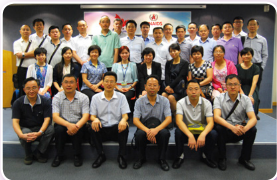
一個來自四川的考察團於2014年8月7日探訪紅絲帶中心