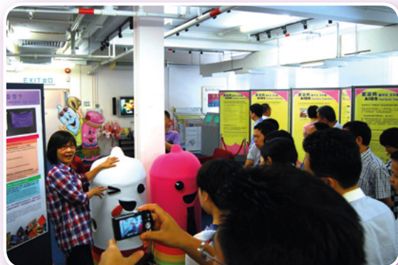
一個來自四川的考察團於2014年8月7日探訪紅絲帶中心