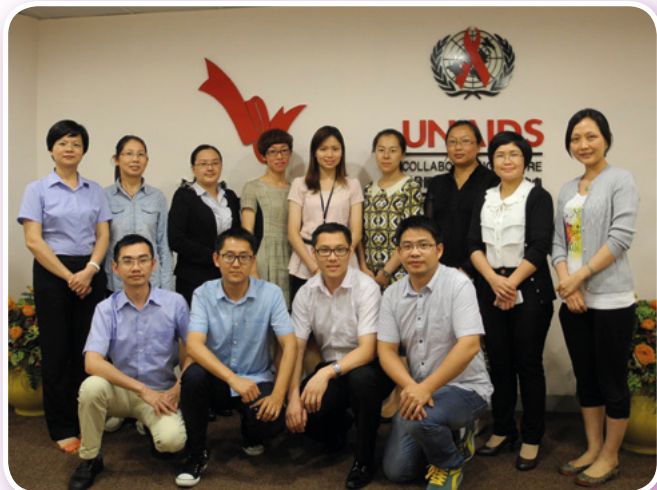
來自廣東“現場流行病學培訓計劃”的代表於2014年5月29日探訪紅絲帶中心

紅絲帶中心接待來自中國內地及澳門機構的訪客，提供平台以加強本港與海外人士在愛滋病防治工作上的合作。2014年的訪客人數共239位。